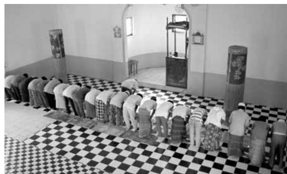
フィリピン最古のモスクで祈る人びと (1993年11月、スル諸島のシムヌル島)

この一五年間、わたしは、フィリピン南部から、マレーシア東部、インドネシア東部にひるがる多島海のサンゴ礁社会で調査をおこなってきた。いずれも、いわゆる東方イスラーム世界を構成している。とはいえ、ムスリムが少数派のフィリピンとムスリムが主流派のマレーシアやインドネシアでは事情がことなっている。たとえばイスラームを公式宗教とするマレーシアは、人口二千五百万のおよそ六割強がムスリムである。そして世界最大のムスリム人口を擁するインドネシアは、人口二億二千万の九割がムスリムである。世界で一二億のムスリム人口の二割ちかくを、インドネシアが占める計算となる。ともに多言語多民族社会であるマ