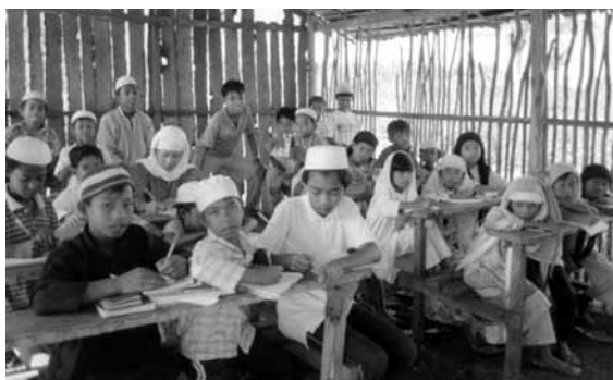
イスラームを学ぶ。 （1993年12月、スル諸島のマヌクマンカウ島）