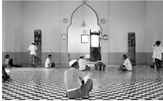
祈りのあと、モスクでくつろぐ人びと (1993年11月、スル諸島のシムヌル島)

在しておらず、マレー語は域内最大市場であるマラッカに参入するため必須言語という機能をはたしていた。フィリピン南部は、このマレー語通商圏の辺部に位置した。とはいえ、みなが民族語とマレー語のバイリン