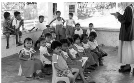
イスラームを学ぶ。 （1994年2月、スル諸島のマヌクマンカウ島）